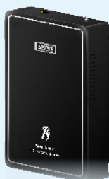
智能極熱式熱飲機 HH88(單相 220V)