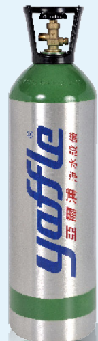
13L (約 2500 瓶 / 500ml)